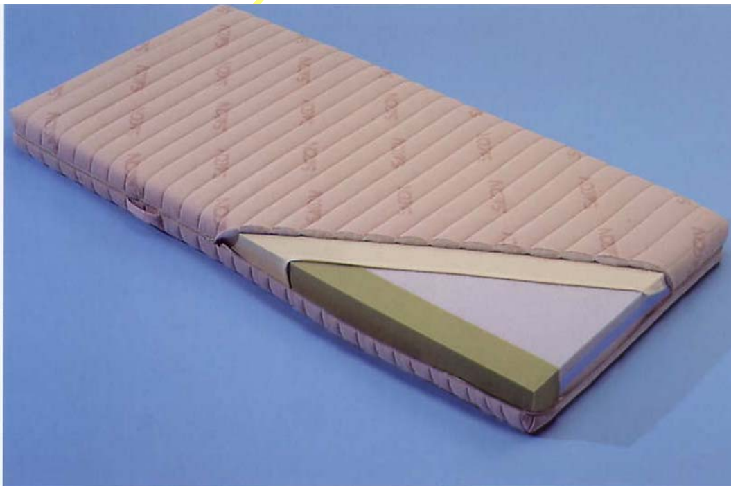
Abb.: Poly-Spezial 12G